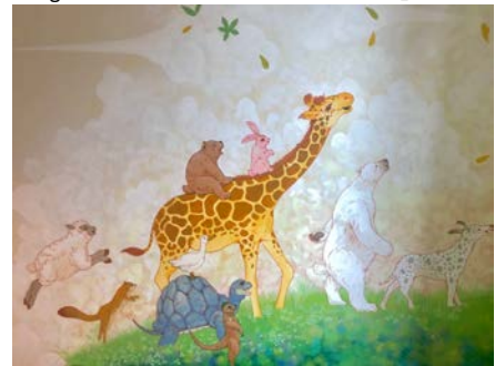
くまたにたかしの作品。こうした作品が光壁を埋める