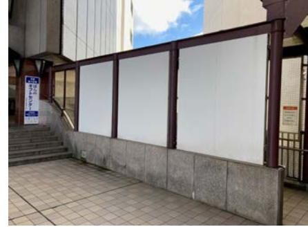
高島屋3階エントランスの壁。ここに作品が現れる

10/3(土)、4(日)、5(月)16:00~深夜 柏高島屋本館3Fエントランス (高校生は3日と4日の16~19時) プロジェクトで壁面に下書きを映し、マスキングテープを貼っていく。